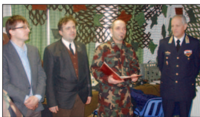
HG5CUT, HA5CBM, Ferencsák ftörm. és dr. Orosz altbgy.

Fontos részlet, amelyet ugyan korábban is említettünk, ám nem lehet elégszer hangsúlyozni: a klub relatíve zárt, oda külsős személy csak az akadémia előzetes engedélye alapján léphet be. Igaz