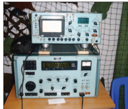
Kiállításrészlet: R-399A RH-vevő